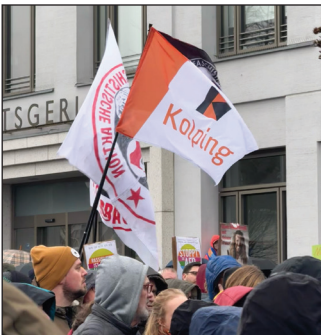
Weithin sichtbar positionieren sich Kolpinger bei Demos in (v.l.) Erkelenz, Mönchengladbach und Düren

In den folgenden Wochen nahmen Kolpinger auch bildgewaltig an Demos in Tönisvorst, Willich, Düren, Jülich, Erkelenz, Niederkrüchten und anderen Orten teil. Wir sagen Danke für dieses wichtige Engagement! WIR SIND MEHR!