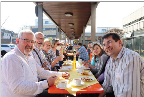
Lachende Gesichter aus 2022 - auf der Kegelbahn und bei Kaffee und Kuchen im Freien

2024. Ab 14 Uhr wird dann wieder auf den acht Kegelbahnen in der Mönchengladbacher Jahnhalle um den Turniersieg gekegelt. Natürlich ist auch für das leibliche Wohl gesorgt - von Kaffee und Kuchen am Nachmittag zu Grillwurst und Salat zum Abschluss am Abend.