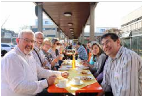
Lachende Gesichter aus 2022 - auf der Kegelbahn und bei Kaffee und Kuchen im Freien