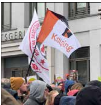
Weithin sichtbar positionieren sich Kolpinger bei Demos in (v.l.) Erkelenz, Mönchengladbach und Düren

In den folgenden Wochen nahmen Kolpinger auch bildgewaltig an Demos in Tönisvorst, Willich, Düren, Jülich, Erkelenz, Niederkrüchten und anderen Orten teil. Wir sagen Danke für dieses wichtige Engagement! WIR SIND MEHR!