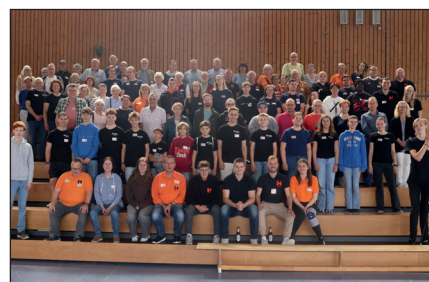
Gruppenfoto in der Halbzeitpause. Wie gut, dass die Jahnhalle auch eine Tribüne hat!