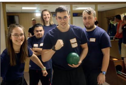
Das Team vom DAK hatte sichtlich Spaß, aber sportlich leider keinen Erfolg (Mixed Platz 8)