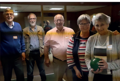
Den Team-Sieg und erste Plätze in der Herren-Wertung erkegelten sich die Grefrather