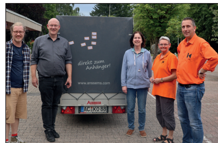
Alles zurück im Anhänger - das Orgateam vom Diözesanbüro freute sich über eine rundum gelungene Veranstaltung.