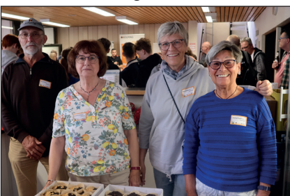
Das Küchenteam von „Aktiv ab 50“ sorgte für die Versorgung der Sportler*innen mit Kaffee und Kuchen